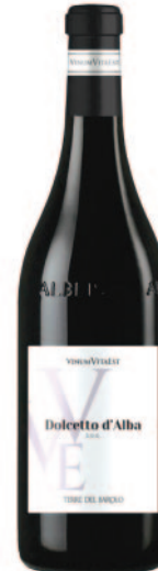
DOLCETTO D'ALBA DOC