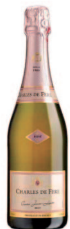
CRÉMANT DE BOURGOGNE ROSÉ