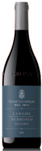
LANGHE NEBBIOLO ROCCARDO