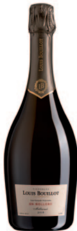
EN BOLLERY MILLÉSIMÉ 2019 EXTRA-BRUT