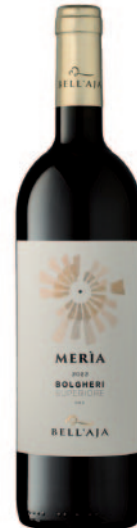
MERIA BOLGHERI SUPERIORE DOC CABERNET FRANC