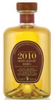
RUCHÈ RISERVA 2010