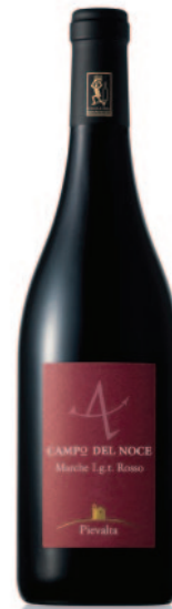
CAMPO DEL NOCE MONTEPULCIANO