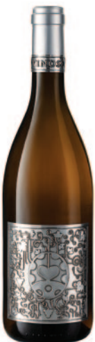
VINOSO GRECHETTO IGT