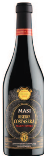
COSTASERA AMARONE CLASSICO RISERVA DOCG