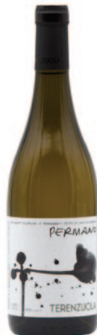
PERMANO VERMENTINO TREBBIANO