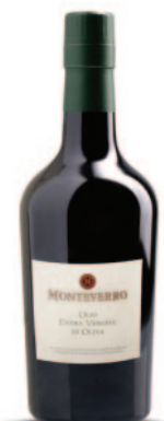
OLIO EXTRA VERGINE DI OLIVA