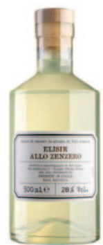
ELISIR ALLO ZENZERO