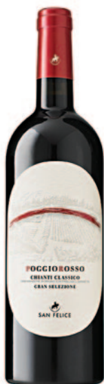
POGGIO ROSSO CHIANTI CLASSICO DOCG GRAN SELEZIONE