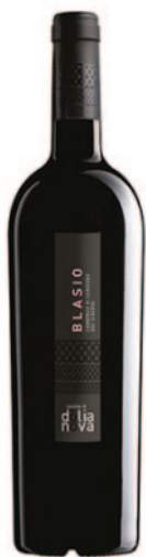
BLASIO CANNONAU DI SARDEGNA DOC RISERVA