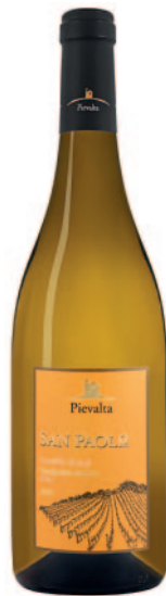
VERDICCHIO SAN PAOLO DOC