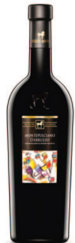
MONTEPULCIANO D'ABRUZZO DOC