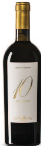
10 VENDEMMIE BIANCO