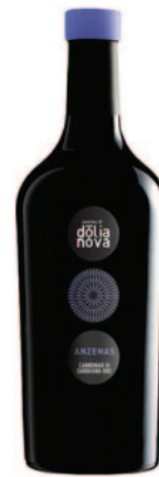
ANZENAS CANNONAU DI SARDEGNA DOC