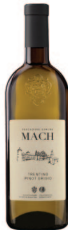
PINOT GRIGIO DOC