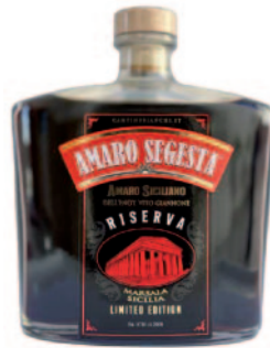
AMARO SEGESTA RISERVA