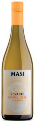
LEVARIE SOAVE CLASSICO DOC