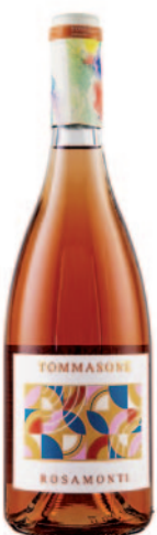
ROSAMONTI IGP AGLIANICO E PIEDIROSSO