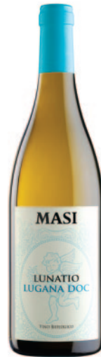
LUNATIO LUGANA DOC