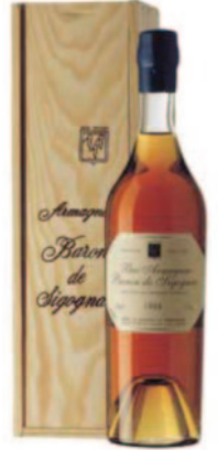
MILLESIMATI DAL 1893 AL 2012