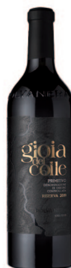
GIOIA DEL COLLE PRIMITIVO RISERVA