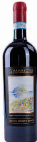
TENUTA MONTE ZUNTA ISCHIA PIEDIROSSO DOC