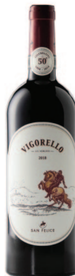
VIGORELLO TOSCANA IGT