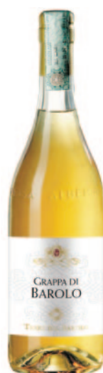
GRAPPA DI BAROLO