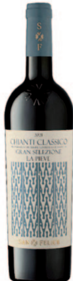
LA PIEVE CHIANTI CLASSICO DOCG GRAN SELEZIONE