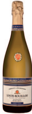
PERLE D'IVOIRE BLANC DE BLANCS EXTRA-BRUT