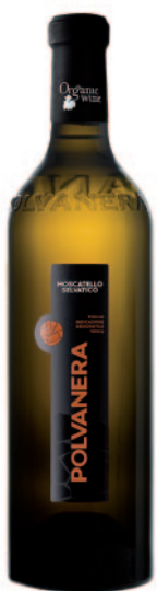
MOSCATELLO SELVATICO DOLCE