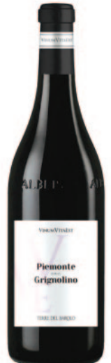
PIEMONTE GRIGNOLINO DOC