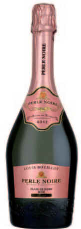
PERLE NOIRE BLANC DE NOIRS ROSÉ BRUT