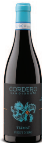
TIAMAT PINOT NERO