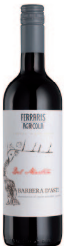
BARBERA D'ASTI DEL MARTÍN