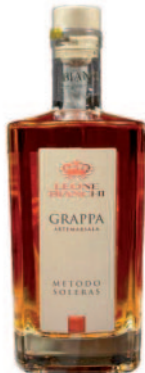
GRAPPA METODO SOLERAS