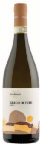
GRECO DI TUFO DOCG