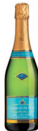
CRÉMANT DE BOURGOGNE