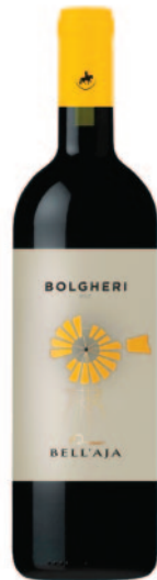
BELL'AJA BOLGHERI DOC