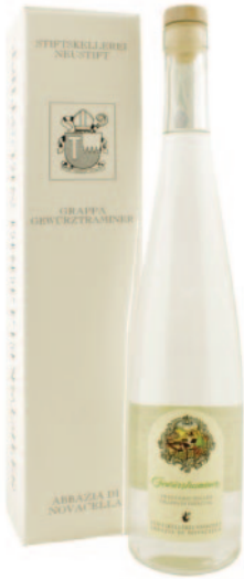
GRAPPE DI GEWÜRZTRAMINER KERNER SYLVANER