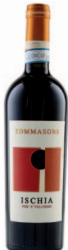
PER'È PALUMMO DOC PIEDIROSSO