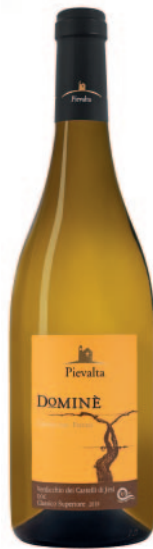
VERDICCHIO DOMINÈ DOC