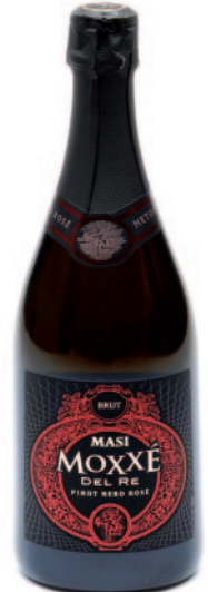
MOXXÉ DEL RE ROSÉ METODO CLASSICO