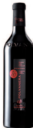
GIOIA DEL COLLE PRIMITIVO 16