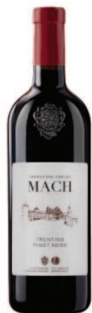
PINOT NERO DOC