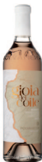
GIOIA DEL COLLE ROSATO