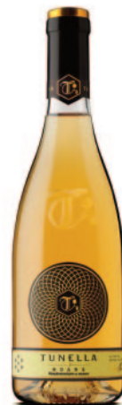
NOANS RIESLING TRAMINER SAUVIGNON