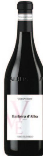
BARBERA D'ALBA DOC