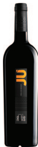
JÙ ISOLA DEI NURAGHI IGT