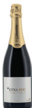
ETNA ROSÉ METODO CLASSICO