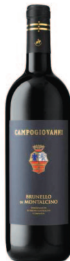
BRUNELLO DI MONTALCINO DOCG