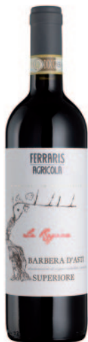
BARBERA D'ASTI LA REGINA