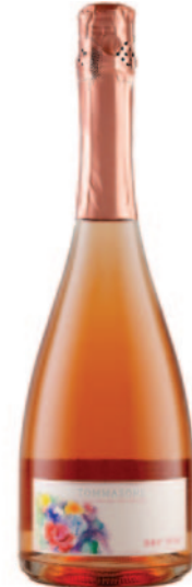
BRI 1955 DOSAGGIO ZERO AGLIANICO