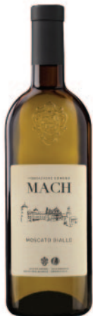
MOSCATO GIALLO DOC