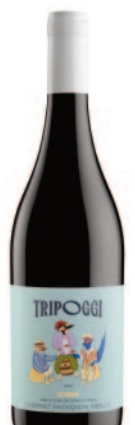
TRIOGGI CABERNET SAUVIGNON MERLOT