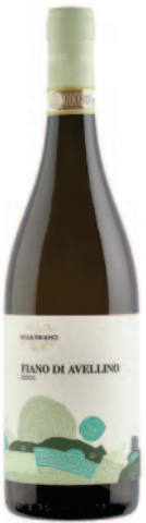
FIANO DI AVELLINO DOCG