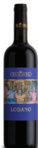
LODANO ROSSO PV-ME