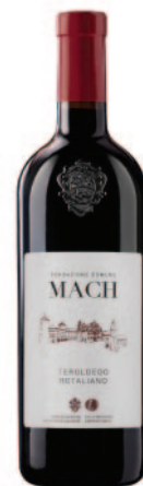
TEROLDEGO ROTALIANO DOC