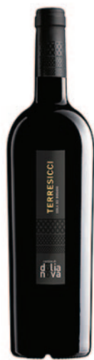
TERRESICCI BARBERA SARDA IGT