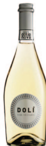
DOLÌ VINO FRIZZANTE