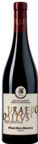
PRAEPOSITUS PINOT NERO "RISERVA"