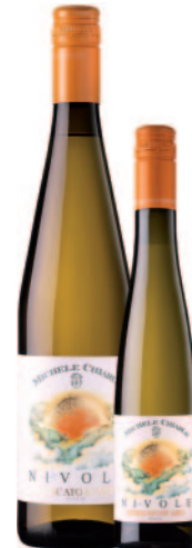
NIVOLE MOSCATO D'ASTI