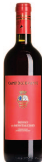
ROSSO DI MONTALCINO DOC