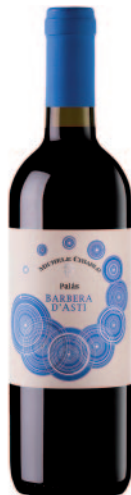
PALÁS BARBERA D'ASTI