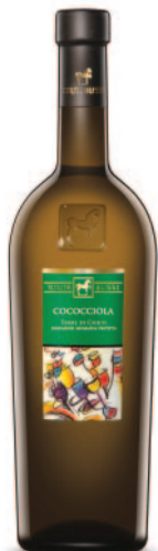
COCOCCIOLA IGT TERRE DI CHIETI