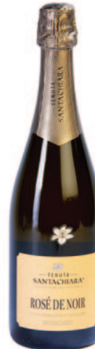
ROSÉ DE NOIR