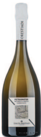
CARRICANTE METODO CLASSICO