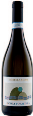
ISCHIA FORASTERA DOC