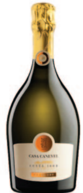
CUVÉE 1000 EXTRA DRY