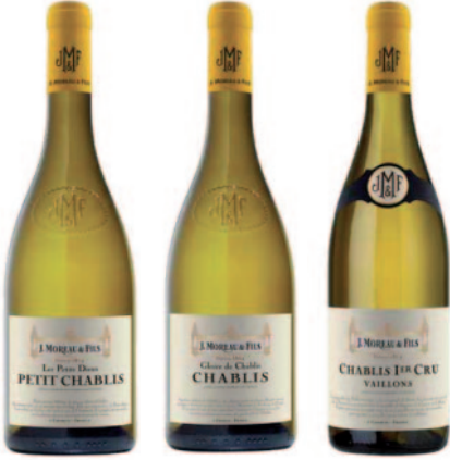
PETIT CHABLIS CHABLIS CHABLIS 1 ER CRU