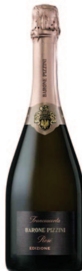
ROSÈ EXTRA BRUT