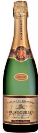
PERLE DE VIGNE GRANDE RÉSERVE