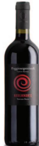
MAREMMANTE CABERNET FRANC SYRAH