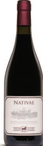
NATIVE MONTEPULCIANO D'ABRUZZO DOC