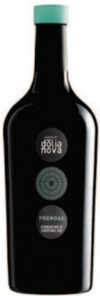
PRENDAS VERMENTINO DI SARDEGNA DOC