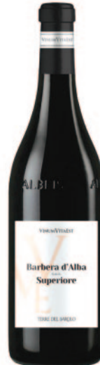
BARBERA D'ALBA SUPERIORE DOC