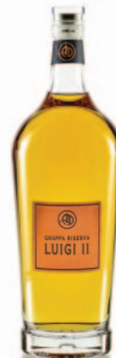
LUIGI II RISERVA