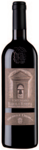
TORTONIANO BAROLO RISERVA