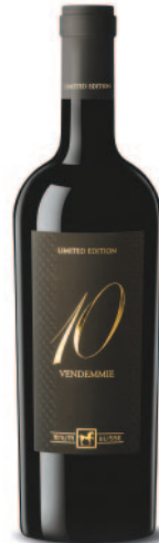
10 VENDEMMIE ROSSO