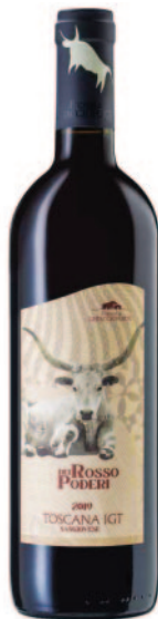
ROSSO DEI PODERI SANGIOVESE IGT