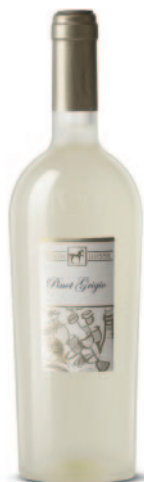
PINOT GRIGIO PREMIUM