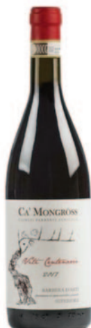
BARBERA D'ASTI VITI CENTENARIE