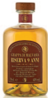
MALVASIA RISERVA 9 ANNI