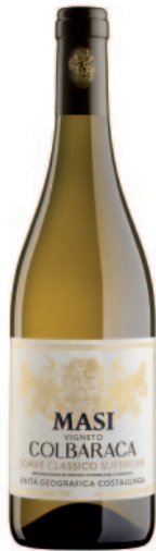
COLBARACA SOAVE CLASSICO SUPERIORE DOCG