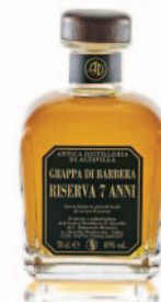
BARBERA RISERVA 7 ANNI