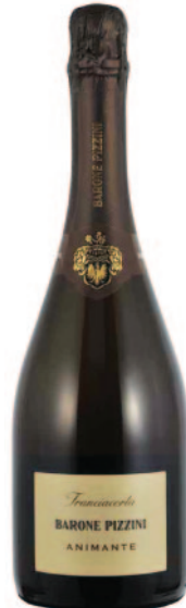
ANIMANTE DOSAGGIO ZERO