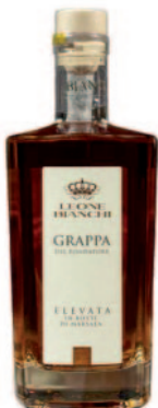
GRAPPA DEL FONDATORE