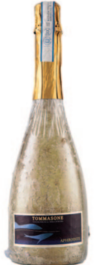
APHRODITE SPUMANTE ISCHIA BIANCO