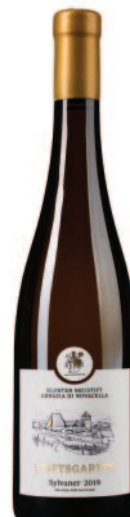
STIFTSGARTEN SYLVANER VIGNA