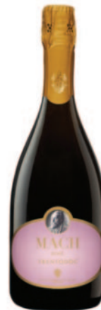
MACH ROSÈ RISERVA DEL FONDATORE