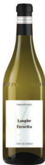
LANGHE FAVORITA DOC