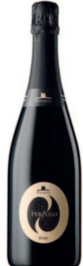
PERLUGO DOSAGGIO ZERO