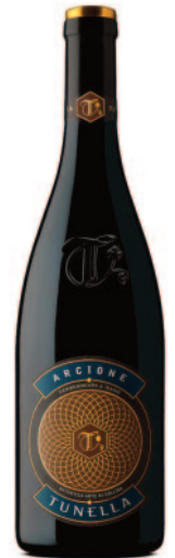
ARCIONE PIGNOLO SCHIOPPETTINO