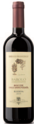
BAROLO ROCCHES DELL'ANNUNZIATA BRICCO FRANCESCO