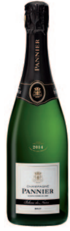
BLANC DE NOIRS BRUT