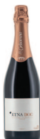
ETNA METODO CLASSICO