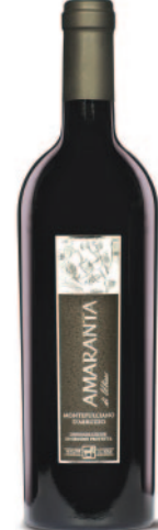
MONTEPULCIANO D'ABRUZZO DOC AMARANTA