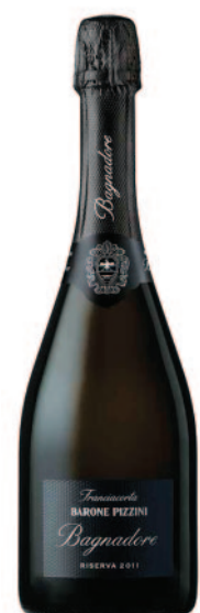
BAGNADORE DOSAGGIO ZERO