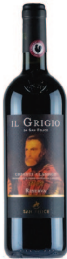
IL GRIGIO CHIANTI CLASSICO RISERVA DOCG