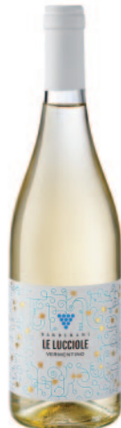
LE LUCCIOLE VERMENTINO IGT