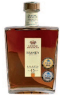
BRANDY 15 ANNI