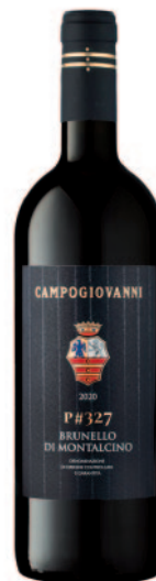
BRUNELLO DI MONTALCINO DOCG P#327