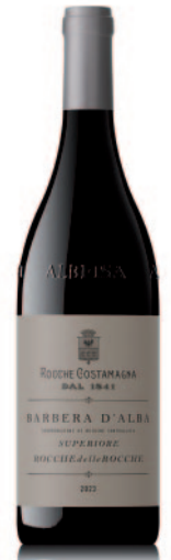
BARBERA D'ALBA SUPERIORE