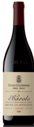
BAROLO ROCCHES DELL'ANNUNZIATA RISERVA