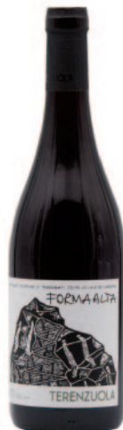
FORMA ALTA VERMENTINO NERO MASSARETTA