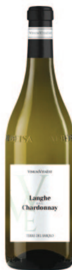
LANGHE CHARDONNAY DOC