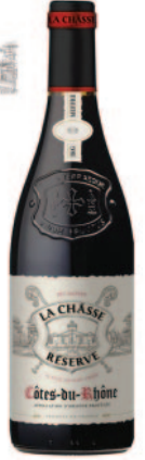
CÔTES DU RHÔNE RÉSERVE