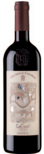
LA COURT NIZZA RISERVA