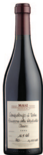
CAMPOLONGO DI TORBE AMARONE CLASSICO DOCG