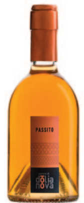
MOSCATO PASSITO DOC