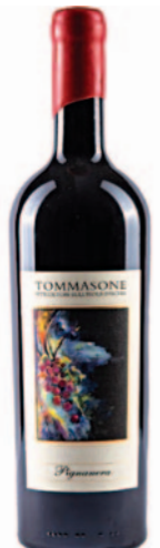
PIGNANERA IGP AGLIANICO E MONTEPULCIANO