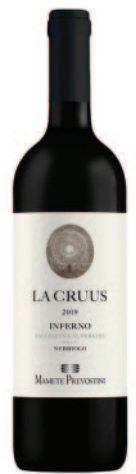
INFERNO VALTELLINA SUPERIORE LA CRUIS