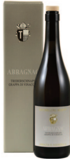
GRAPPA RISERVA ABBAGNAC