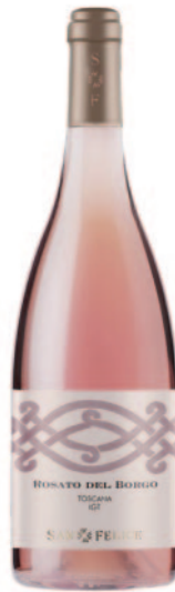
ROSATO DEL BORGO TOSCANA IGT