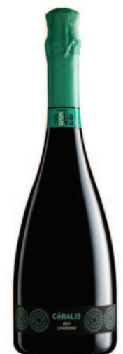
CÁRALIS BRUT CHARDONNAY