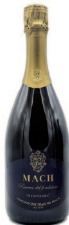
MACH RISERVA DEL FONDATORE