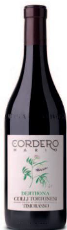
TIMORASSO COLLI TORTONESI