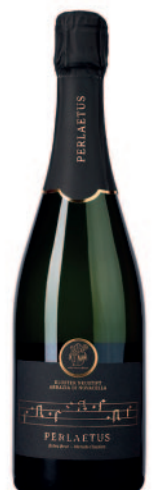
PERLAETUS EXTRA BRUT METODO CLASSICO SYLVANER 36 MESI