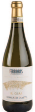
MOSCATO D'ASTI IL GIAJ