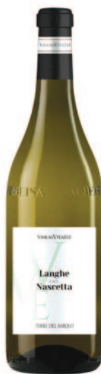
LANGHE NASCETTA DOC