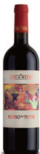
ROSSO DEI NOTRI CS-CF-ME-SY