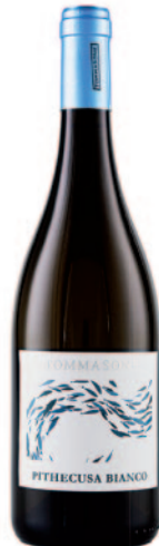
PITHECUSA IGP BIANCO BIANCOLELLA-FIANO