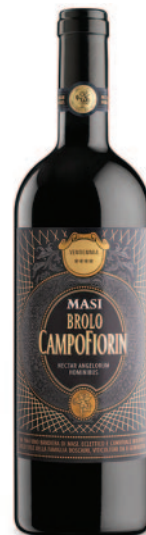
BROLO CAMPOFIORIN IGT