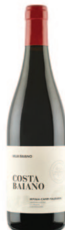
COSTA BAIANO CAMPI TAURASINI