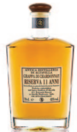
CHARDONNAY RISERVA 11 ANNI