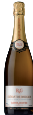
CRÉMANT DE BORDEAUX