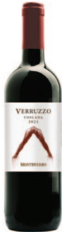
VERRUZZO DI MONTEVERRO