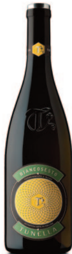
BIANCOSTESTO RIBOLLA FRIULANO