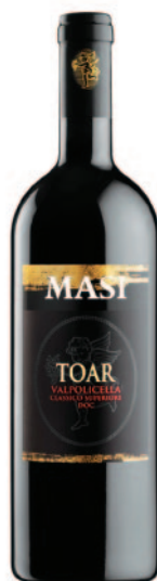
TOAR VALPOLICELLA CLASSICO SUPERIORE DOC