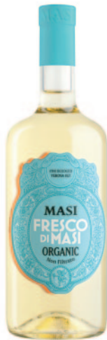
FRESCO DI MASI IGT