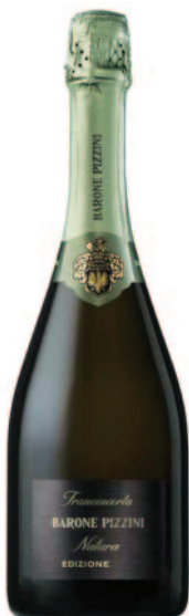
NATURAE DOSAGGIO ZERO