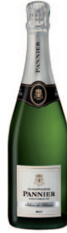
BLANC DE BLANCS BRUT