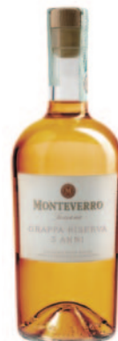
GRAPPA BARRIQUE 3 ANNI