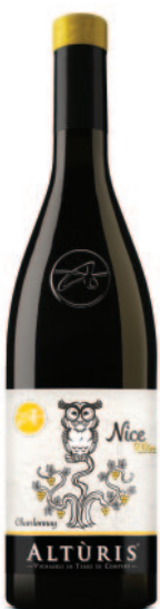
NICE WINE CHARDONNAY