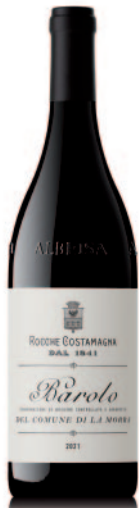
BAROLO LA MORRA