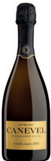
MILLESIMATO VALDOBBIADENE EXTRA DRY