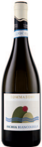
ISCHIA BIANCOLELLA DOC