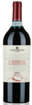
LUDOVICO ROSSO RISERVA