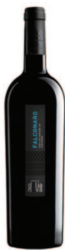
FALCONARO CARIGNANO ISOLA DEI NURAGHI IGT