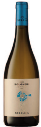
BELL'AJA BOLGHERI BIANCO DOC