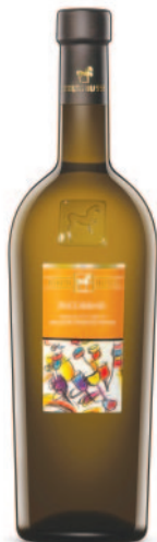
PECORINO IGT TERRE DI CHIETI