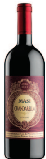
GRANDARELLA REFOSCO DELLE VENEZIE IGT