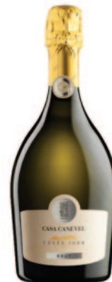
CUVÉE 1000 BRUT