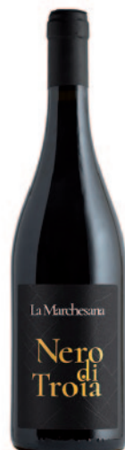
NERO DI TROIA