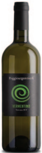
VERMENTINO DI TOSCANA