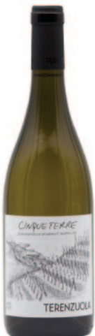
CINQUETERRE BOSCO VERMENTINO ALBAROLA RUZZESE