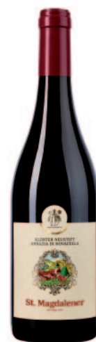
SANTA MADDALENA SCHIAVA LAGREIN