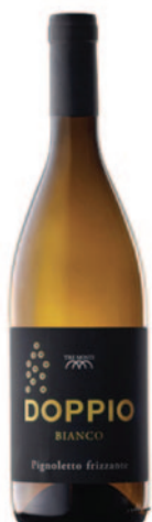
DOPPIO BIANCO PIGNOLETTO FRIZZANTE