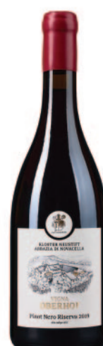
VIGNA OBERHOF PINOT NERO "RISERVA"