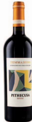
PITHECUSA ROSSO IGP AGLIANICO E PIEDIROSSO