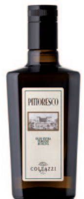
PITTORESCO OLIO EXTRA VERGINE D'OLIVA