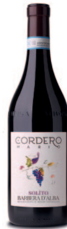
SOLITO BARBERA D'ALBA