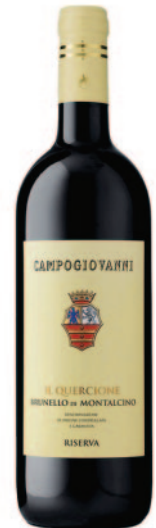
BRUNELLO DI MONTALCINO DOCG RISERVA IL QUERCIONE