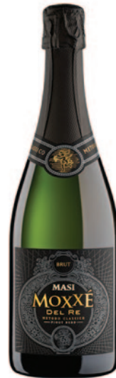
MOXXÉ DEL RE METODO CLASSICO