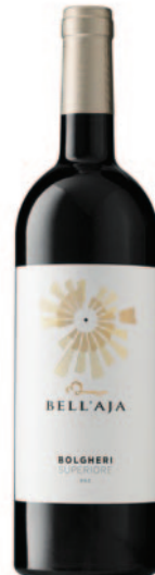
BOLGHERI ROSSO SUPERIORE DOC