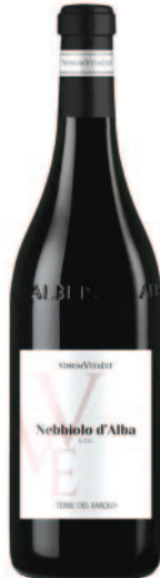
NEBBIOLO D'ALBA DOC