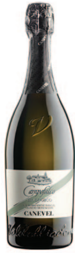
CAMPOFALCO VALDOBBIADENE BRUT