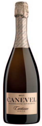
CARTIZZE VALDOBBIADENE BRUT