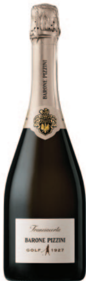
GOLF 1927 EXTRA BRUT