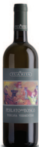
PERLATO DEL BOSCO VERMENTINO