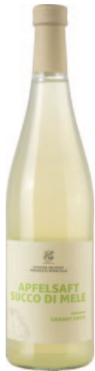
SUCCO DI MELA GRANNY SMITH