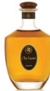
I TRE LUSTRI