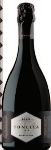
CUVÉE MADRE PINOT NERO