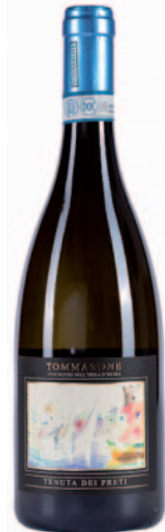
TENUTA DEI PRETI ISCHIA BIANCOLELLA