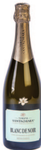
BLANC DE NOIR