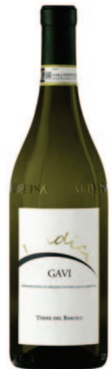
GAVI UNDICI DOC