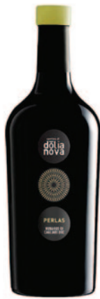
PERLAS NURAGUS DI CAGLIARI DOC