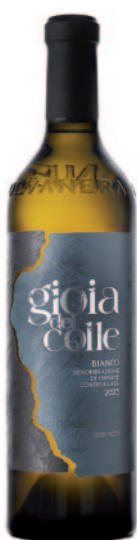
GIOIA DEL COLLE BIANCO