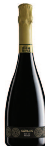
CÁRALIS DEMI SEC MALVASIA SARDA