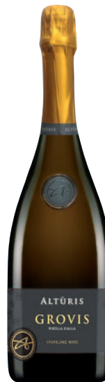
RIBOLLA GIALLA GROVIS