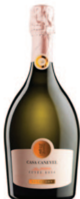
CUVÉE ROSA EXTRA DRY