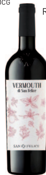
VERMOUTH DI SAN FELICE