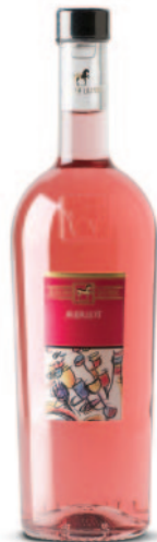
MERLOT IGT TERRE DI CHIETI