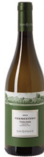
VERMENTINO TOSCANA IGT