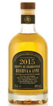
CHARDONNAY RISERVA 6 ANNI