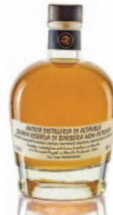
RISERVA BARBERA NON FILTRATA