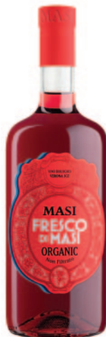
FRESCO DI MASI IGT