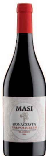
BONACOSTA VALPOLICELLA CLASSICO DOC