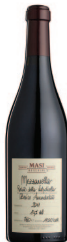
MEZZANELLA RECIOTO CLASSICO AMANDORLATO DOCG