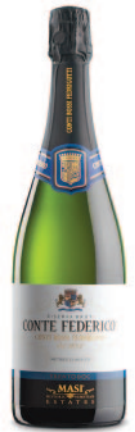
TRENTO DOC RISERVA