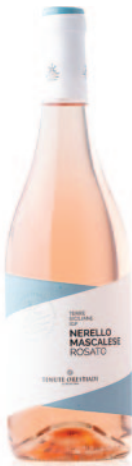
NERELLO MASCALESE ROSATO