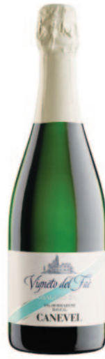
VIGNETO DEL FAÈ VALDOBBIADENE EXTRA BRUT