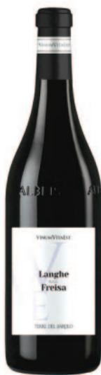
LANGHE FREISA DOC