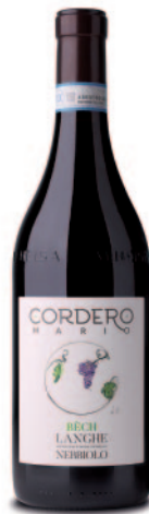
BÉCH LANGHE NEBBIOLO