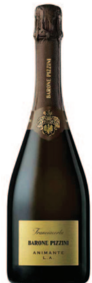
ANIMANTE L.A. DOSAGGIO ZERO