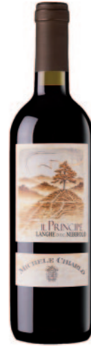
IL PRINCIPE LANGHE NEBBIOLO