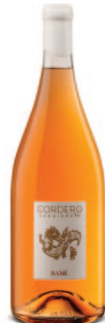
RAMÉ PINOT GRIGIO