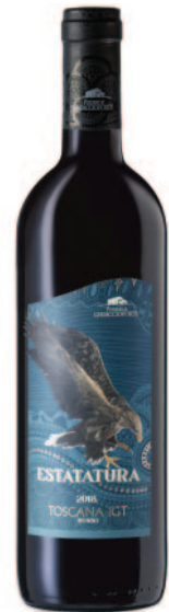
ESTATATURA SANGIOVESE CARIGNANO