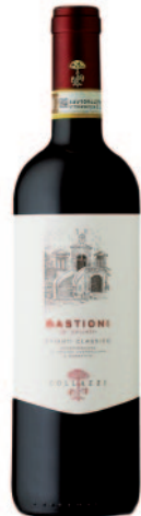
BASTIONI CHIANTI CLASSICO