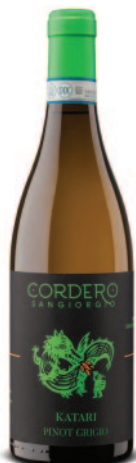
KATARI PINOT GRIGIO