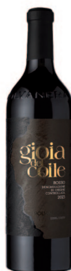
GIOIA DEL COLLE ROSSO