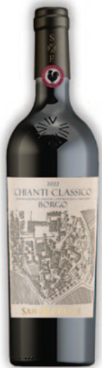
CHIANTI CLASSICO BORGO DOCG