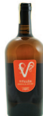
VITALBA ALBANA SECCO ANFORA GEORGIANA