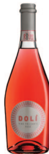
DOLÌ ROSÈ VINO FRIZZANTE