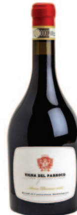
VIGNA DEL PARROCO RUCHÈ DI CASTAGNOLE MONFERRATO