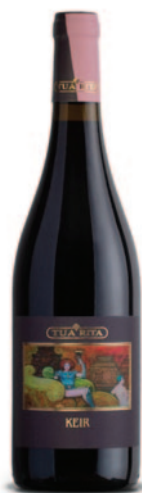
KEIR ROSSO SYRAH