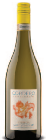
EXERGIA MOSCATO D'ASTI