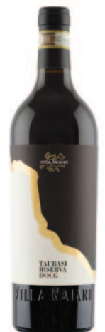
TAURASI RISERVA DOCG