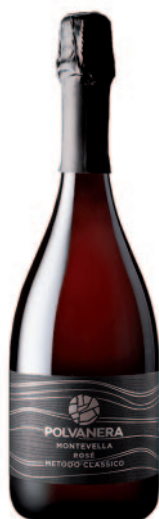
MONTEVELLA METODO CLASSICO ROSÉ