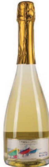
ISCHIA BIANCO EXTRA BRUT DOC