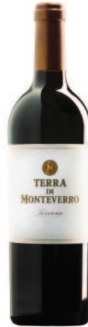
TERRA DI MONTEVERRO CF-CS-MER-PV