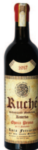
RUCHÈ RISERVA OPERA PRIMA