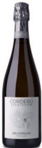
MILLESIMATO METODO CLASSICO