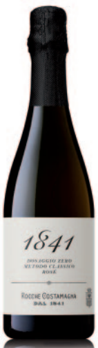
1841 DOSAGGIO ZERO ROSÉ