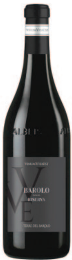
BAROLO RISERVA DOCG