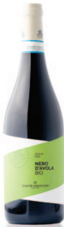
NERO D'AVOLA Bio