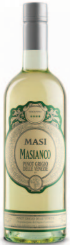
MASIANCO PINOT GRIGIO DELLE VENEZIE DOC