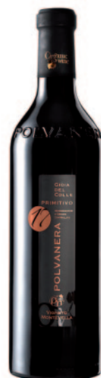
GIOIA DEL COLLE PRIMITIVO 17