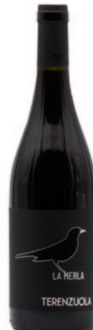
CANNAIOLO NERO LA MERLA