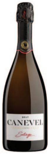
SETÀGE VALDOBBIADENE BRUT