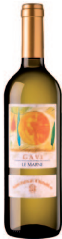
LE MARNE GAVI