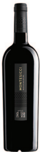
MONTESICCI NASCO DI CAGLIARI DOC