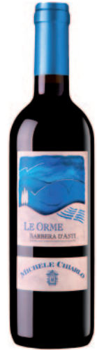
LE ORME BARBERA D'ASTI