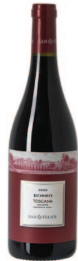
ROSSO TOSCANA IGT