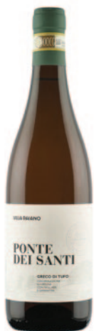
PONTE DEI SANTI GRECO DI TUFO DOCG