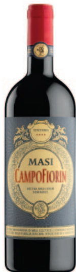
CAMPOFIORIN ROSSO DI VERONA IGT