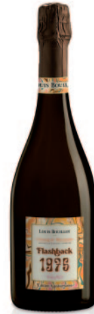
FLASHBACK 1975 EXTRA-BRUT