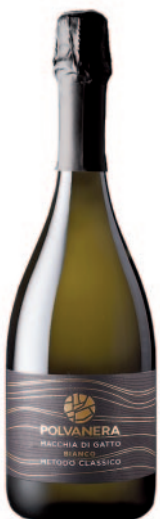
MACCHIA DI GATTO METODO CLASSICO