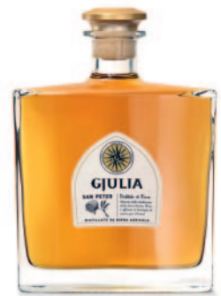
SAN PETER DISTILLATO DI BIRRA