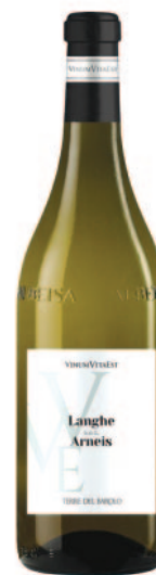
ROERO ARNEIS DOC