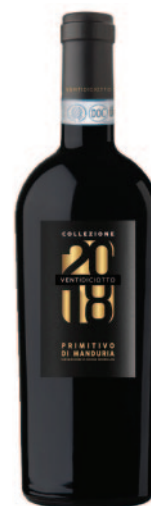
PRIMITIVO DI MANDURIA