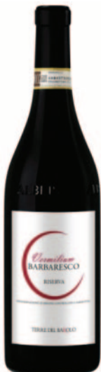
BARBARESCO VERMILIMUM DOCG