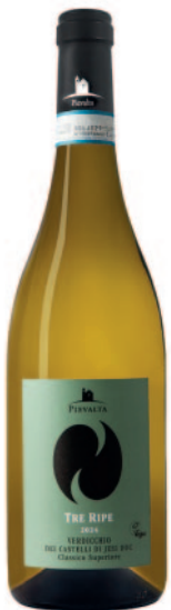
VERDICCHIO TRE RIPE DOC