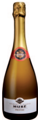
CRÉMANT D'ALSACE BRUT