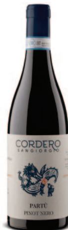
PARTÙ PINOT NERO RISERVA