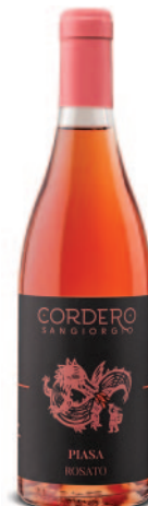
PIASA ROSATO CROATINA