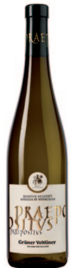
PRAEPOSITUS GRÜNER VELTLINER