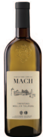
MÜLLER THURGAU DOC