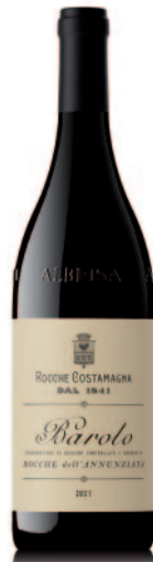
BAROLO ROCCHES DELL'ANNUNZIATA