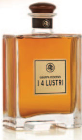
I 4 LUSTRI