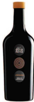
ARENADA MONICA DI SARDEGNA DOC