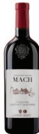
CABERNET SAUVIGNON DOC