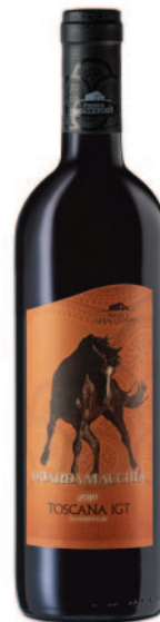
GUARDAMACCHIA SANGIOVESE IGT