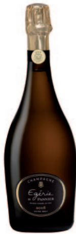
EGÉRIE 2008 EXTRA-BRUT