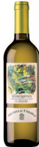
LE MADRI ROERO ARNEIS