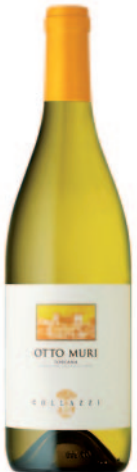
OTTO MURI FIANO