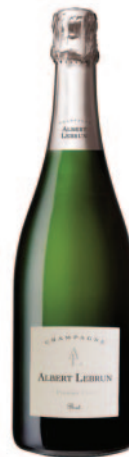
PREMIER CRU BRUT