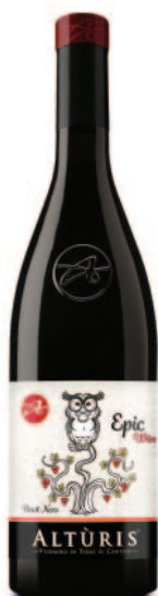
EPIC WINE PINOT NERO