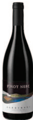
PINOT NERO IGT