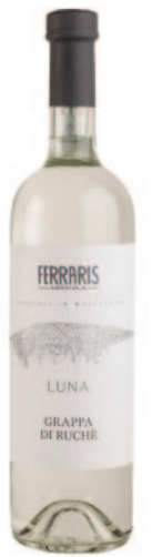
GRAPPA LUNA RUCHÈ