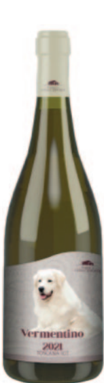
VERMENTINO TOSCANA IGT