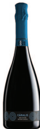
CÁRALIS BRUT NATURE VERMENTINO METODO CL.