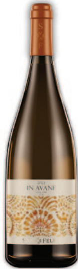
IN AVANE CHARDONNAY IGT