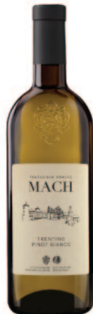
PINOT BIANCO DOC