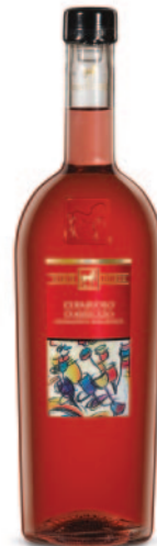
CERASUOLO D'ABRUZZO DOC