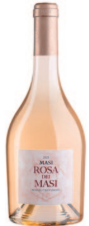
ROSA DEI MASI ROSATO TREVENEZIE IGT