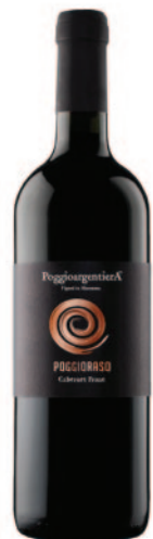
POGGIORASO CABERNET FRANC