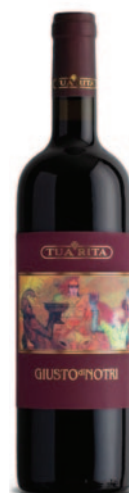
GIUSTO DI NOTRI CS-ME-CF