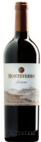
MONTEVERRO CF-CS-MER- PV