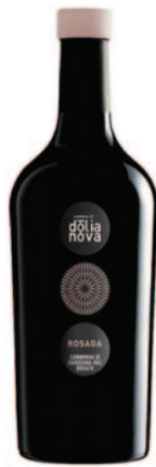
ROSADA CANNONAU DI SARDEGNA DOC ROSATO