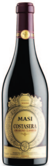
COSTASERA AMARONE CLASSICO DOCG