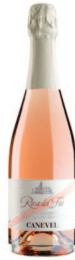
ROSA DEL FAÈ VALDOBBIADENE BRUT