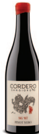
SG '67 PINOT NERO