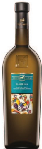
PASSERINA IGT TERRE DI CHIETI